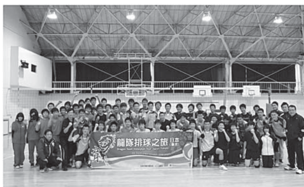
図1 香港チームと高校生との交流

そして最後にお互いの代表がスピーチを行い、記念撮影を行った（図1）。4月2日は、香港チームと大学生との交流活動（練習ゲーム）を行った。香港チームは、ツーリズムの主目的である大会終了後であったことから、大会にあまり出場することのなかった選手を中心にチームを編成し、練習ゲームを行った。